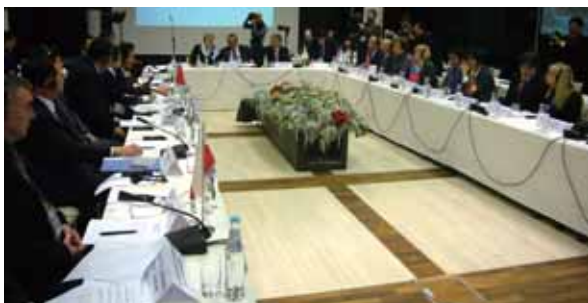
マールドゥ市長会議の様子

市長会議は、市長自らが各都市の取組み事例を紹介し、市長同士が膝を交えて率直な意見交換を行う格好の機会となっています。