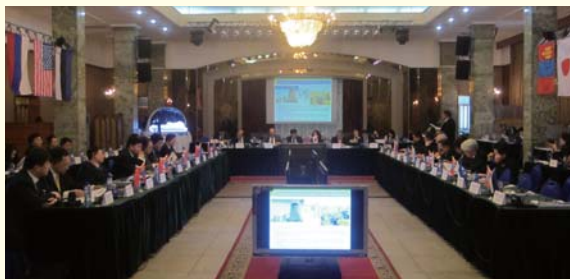
ウランバートル市長会議の様子

市長会議は、市長自らが各都市の取組事例を紹介し、都市経営の最高責任者である市長同士が膝を交えて率直に意見交換を行うというユニークかつ格好の機会となっています。