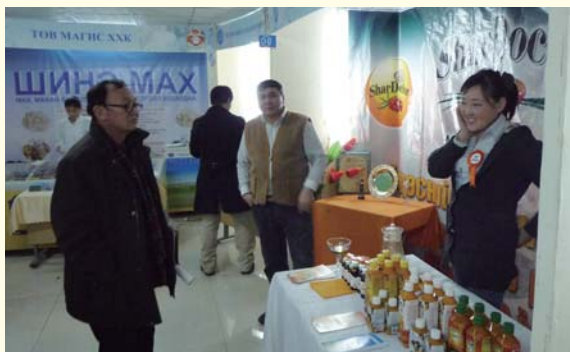
冬の見本市の様子

1988年の第3回会議から市民も参加して開催されるようになり、世界冬の都市市長会議は、地域も巻き込んだ大きなイベントに発展しました。