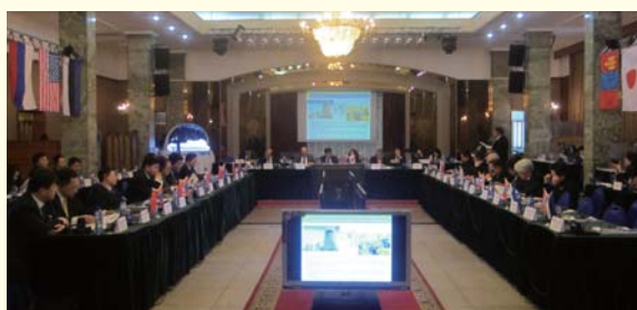
ウランバートル市長会議の様子

市長会議は、市長自らが各都市の取組事例を紹介し、都市経営の最高責任者である市長同士が膝を交えて率直に意見交換を行うというユニークかつ格好の機会となっています。