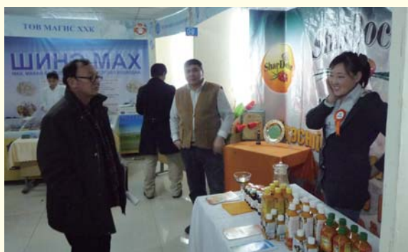
冬の見本市の様子

1988年の第3回会議から市民も参加して開催されるようになり、世界冬の都市市長会議は、地域も巻き込んだ大きなイベントに発展しました。