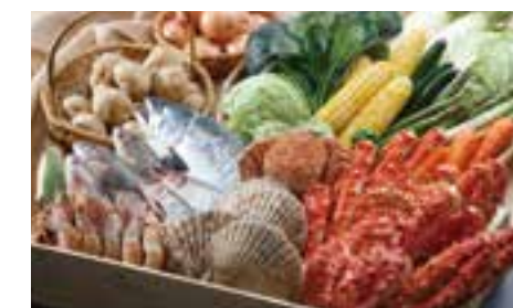
汇集北海道各地美食的札幌