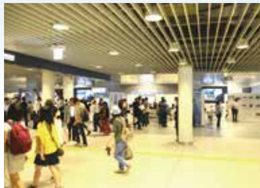
Chi·Ka·Ho(装站前大道地下广场)

召开汇集世界各地会员城市特色物产的展示贩卖会场【冬季城市交易会】,旨在让市民也可轻松体验。预计召开会场为位于市中心人流密集的Chi·Ka·Ho广场。