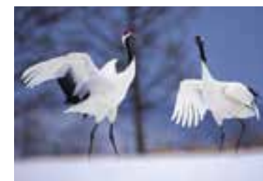
中国·齐齐哈尔丹顶鹤