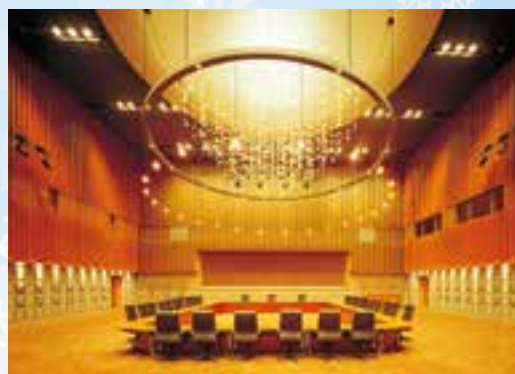
札幌会展中心特别会场

以【冬季城市的规划建设】为主题,冰雪,寒冬,舒适的夏季等,灵活利用冬季城市特有气候特征进行城市规划建设为例进行演讲,讨论。 主论题:冬季城市的规划建设~独特性及其魅力~ 副论题:1为克服冬季困难而应运而生的城市建设;2灵活利用冬季特征的城市建设;3灵活运用冬季以外气候特征的城市建设;4冬季城市的环保建设及可持续性发展城市规划