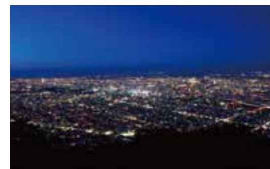
荣获日本新三大夜景的藻岩山夜景