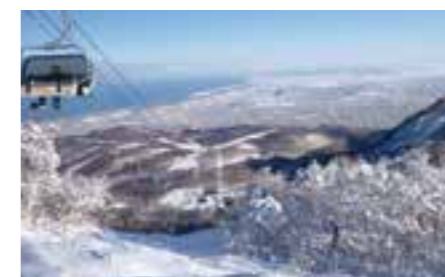
겨울 스포츠도 삿포로의 묘미