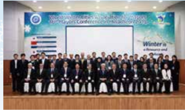
2014 년 화천시장회의

초기의 시장회의에서는 겨울 도시가 눈과 추위를 넘어서 보다 쾌적하게 겨울철에 생활하기 위하여 '겨울철 생활과제'의 해결을 목표로 논의를 실시해 왔습니다.