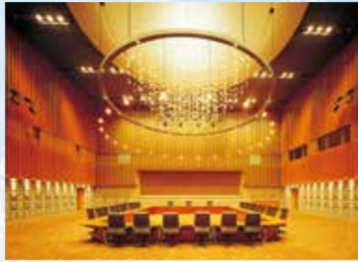
삿포로 컨벤션센터 특별회의장