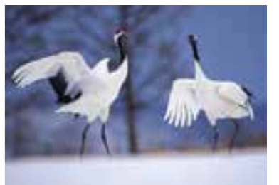
중국 지지하얼의 두루미