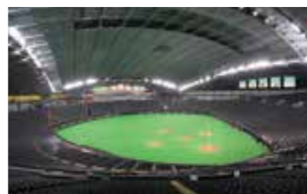
전천후 돔구장인 삿포로돔(스포츠 시설)