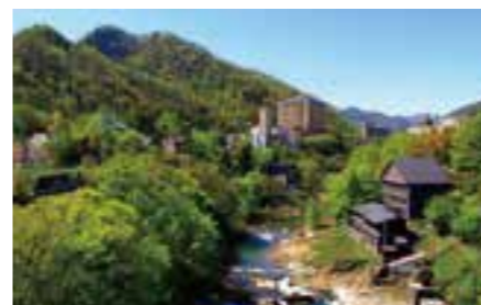
삿포로의 안방, 조젠케이 온천