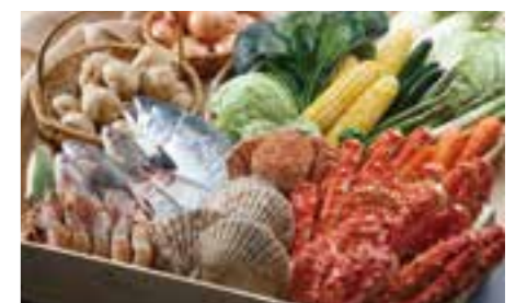
훗카이도의 식재료가 모이는 삿포로