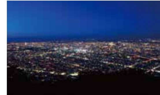
일본 新3대 야경으로 뽑힌 모이와 산