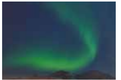
미국 앨버타주의 오로라

세계겨울도시시장회는 국제연합경제사회이사회에 등록된 NPO 이자, 국제연합홍보국에 등록된 NPO 입니다.