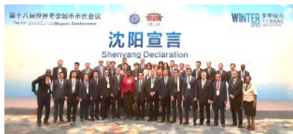
18-я Конференция мэров зимних городов мира (сентябрь 2018 г., Шэньян, Китай)