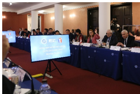
Рабочая встреча в 2019 г. (ноябрь 2019 г., Норильск, Россия)

Встречи проходят раз в 2 года в городе, где размещён секретариат Ассоциации. В ходе рабочей встречи разрабатывают проект плана проведения следующей Конференции мэров и её повестку дня, а также обсуждают вопросы управления Ассоциацией.