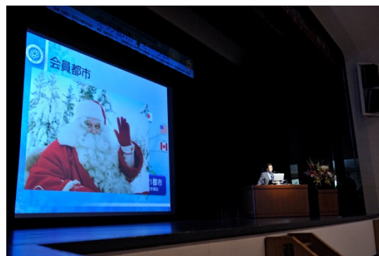
Форум зимних городов (июль 2016 г., Саппоро, Япония)

Город, где проводится Конференция мэров, вправе организовать Форум зимних городов как сопутствующее мероприятие. В ходе этого форума специалисты и учёные из различных областей науки или жители городов выступают с докладами о зимнем образе жизни и благоустройстве города, а также обмениваются мнениями с участниками.