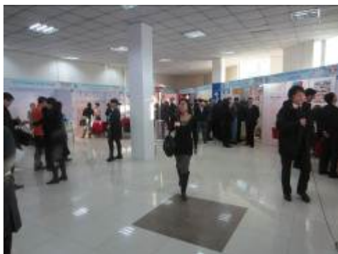
Зимняя выставка (январь 2012 г., Улан-Батор, Монголия)

Город, где проводится Конференция мэров, вправе организовать Зимнюю выставку как сопутствующее мероприятие. На этой выставке, играющей важную роль в развитии экономических связей между зимними городами, фирмы и организации городов-участников экспонируют оборудование и товары, связанные с зимой и снегом, а также представляют различные технологии.