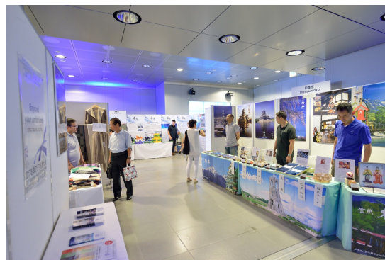
Зимняя выставка (июль 2016 г., Саппоро, Япония)