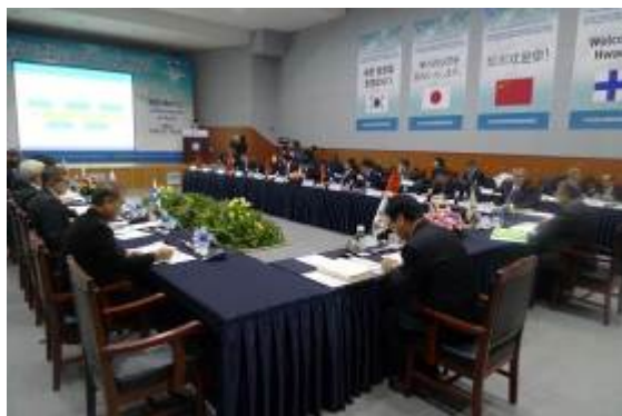
Комитет по сохранению окружающей среды (январь 2014 г., Конференция мэров в Хвачхоне)