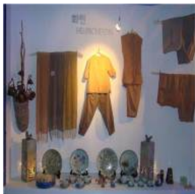
Выставка традиционной одежды и предметов народного творчества